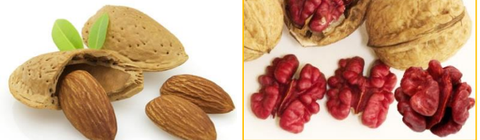
Sychrov, cukrářský ořech