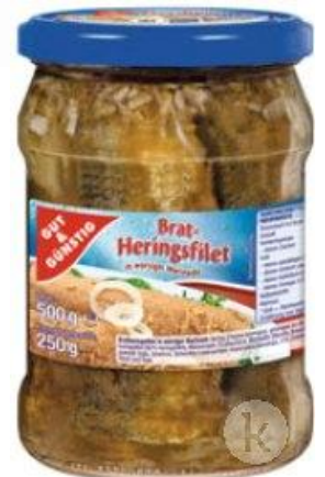
KYSELÉ FILETY V ROSOLU